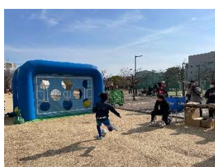
※前回開催の様子（ゲームコーナー）