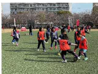
※前回開催の様子（サッカークリニック）