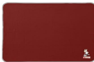
ダイハツオリジナル「カクシカブランケット」 ※画像はイメージです

主催：（一社）兵庫県サッカー協会 TEL：078-232-0753 / FAX：078-232-4647 特別協賛：大阪ダイハツ販売(株)・兵庫ダイハツ販売(株)・ダイハツ工業(株)