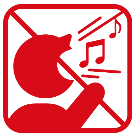
歌を歌うなど声を出しての応援、指笛