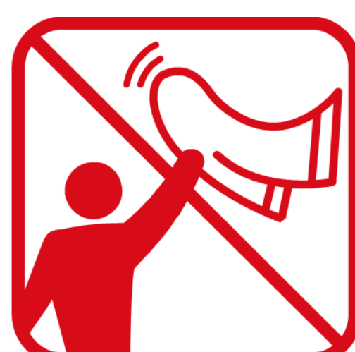
タオルマフラー、大旗含むフラッグなどを「振る・回す」