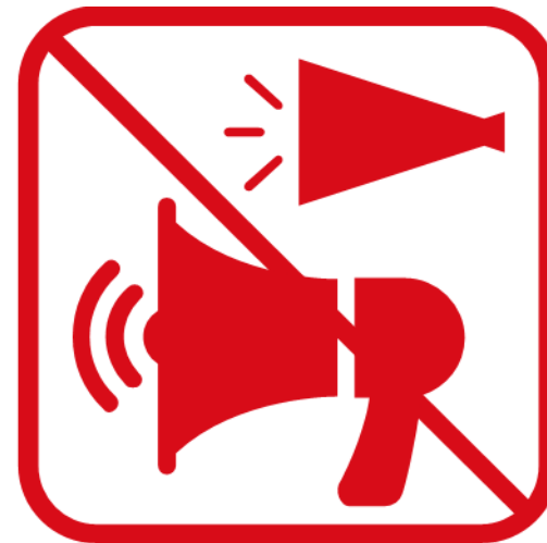
トラメガを含む メガホンの使用