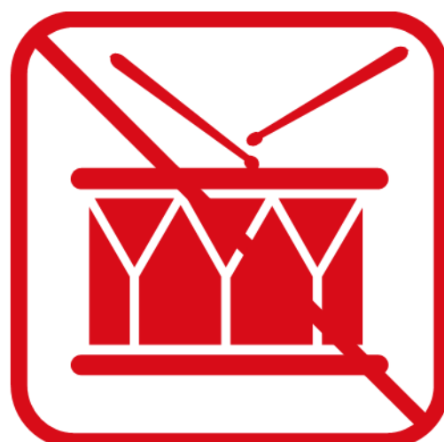
太鼓などの鳴り物