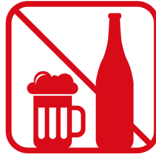
アルコール飲料の 持ち込み