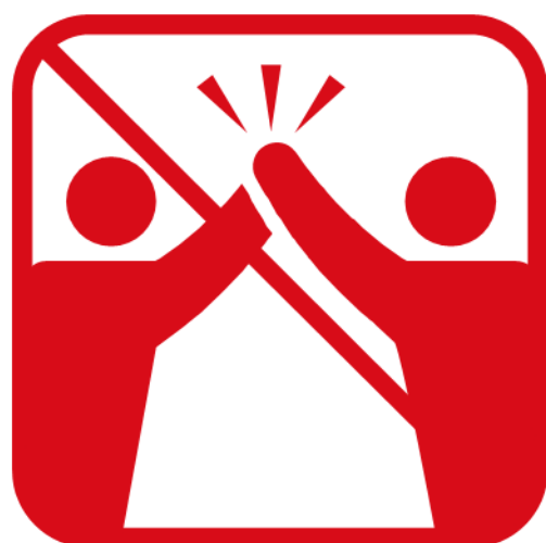
ハイタッチ、肩組み、 握手、抱擁