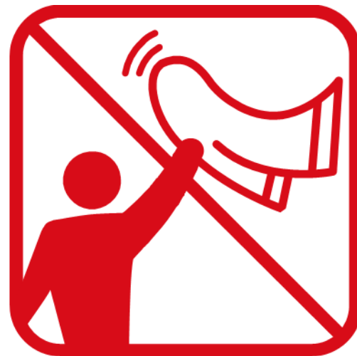
タオルマフラー、大旗含む フラッグなどを「振る・回す」